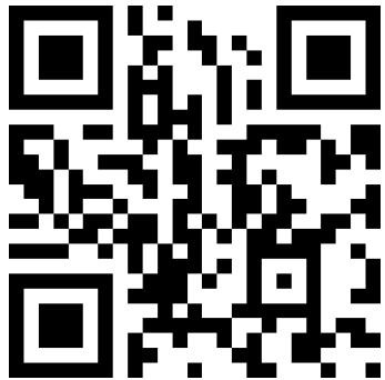
Kasse oder Kassenzettel